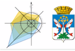
Схема организации улично-дорожной сети М 1:1000